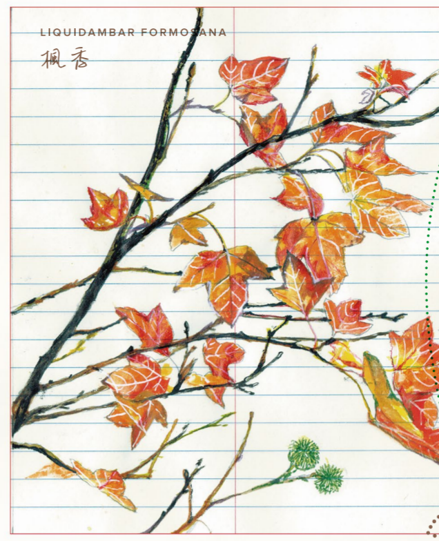
LIQUIDAMBAR FORMOSANA 楓香

風吹枯葉落，落葉生肥土。賞楓季節後期，地上的葉子往往比樹上的多。為什麼楓香有個「香」字？你試試自地上拾起楓香葉，必須尋找紅咖啡色的、乾枯薄脆的葉子，將之輕力揉碎，捧在掌心，接近鼻子，一陣清新的淡香飄然而至，這就是「楓香」名字的由來。