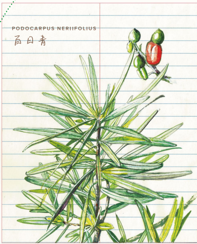
PODOCARPUS NERIFOLIUS 百日青

你坐上石椅，微涼的觸感令你精神一振。欄柵四周有一幅幅舊照片，訴說著香江百年風景。細意留意，前方有棵香港不常見的百日青。樹形優美，樹皮灰褐色，呈纖薄片狀。獨特是樹幹上一圈一圈的波浪，曲線蒼勁有致，有時像洶湧海濤，有時又像湖邊漣漪。