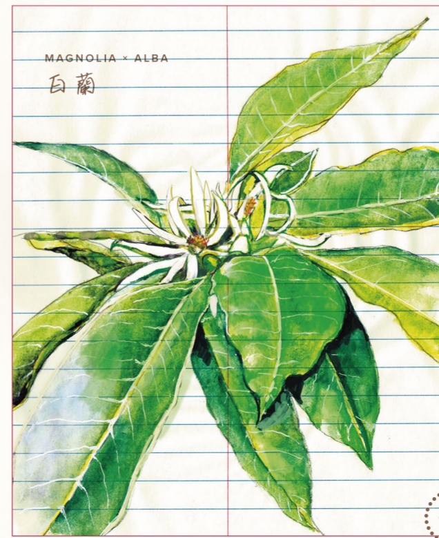
MAGNOLIA x ALBA 白蘭

白蘭花潔白芳香，中國南方女士常摘取花朵來佩戴在身。但事實上，花開不為誰，它們掌握自己生存的節奏。草本植物一年生，亞灌木二、三年，喬木數十載，樟樹幾百年，羅漢松有三千歲。香港有四分之三屬綠色地域，四分之一鋪著建築物。我們此刻身處的這座「市中森」，就像依傍文明的青苔和地衣，呈現出淡淡鏽青色，優雅又含蓄地，訴說著我城的年月。