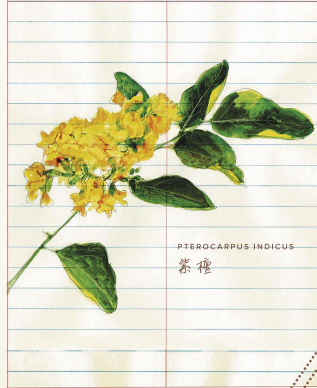
PTEROCARPUS INDICUS 紫檀

它根系發達，樹腳有板根，感覺非常紮實。但並非每棵紫檀都如「市中森」這棵幸運，成長至百歲樹齡依然健康碩壯——因為商業需求殷切，一般紫檀往往未及長成大樹，已成為刀下亡魂。