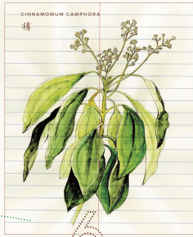
CINNAMOMUM CAMPHORA 樟

每棵樹都是獨立個體，像人一樣。這樹呈三指，上面附生著其他植物——小枝小葉玉石一般青翠，大概是石斛蘭花。樹幹下方有個斷裂的樹洞痕跡，代表它曾經受傷了，後來又痊癒了。時間是修補傷口的藥，癒合後留下獨特的紋路。樹的堅強，造就了其他物種的成長。